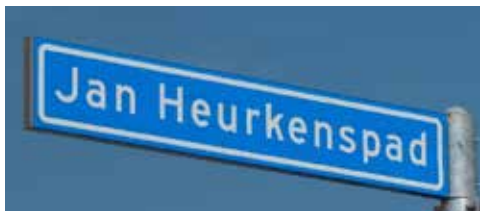
Jan Heurkenspad naast zijn geboortehuis De Lage(n) Hoed in Nederasselt, 2020