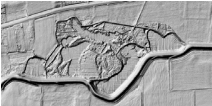
AHN-hillshade beeld van de Erperwaaij bij Heumen