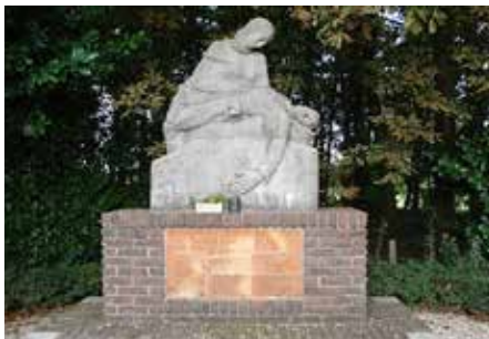
Oorlogsmonument in dorp Heumen, gemaakt door Jac Maris