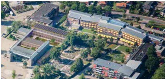
Afbeelding DP6 architectuurstudio

Indien vóór het einde van dit kalenderjaar de herziening van het bestemmingsplan gereed is kan in de loop van volgend jaar met de renovatie worden gestart en zal het dorp Malden hopelijk een nieuwe monumentale bezienswaardigheid rijker zijn.