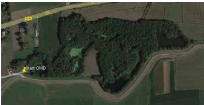
De kwelwallen van de Erperwaaij

In en rond het natte gebiedje de Erperwaaij bij het dorp Heumen liggen wallen (of lage dijkjes)