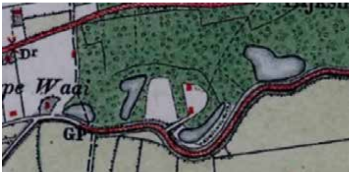
Bonnekaart van omstreeks 1900 van de Erperwaaij met bebouwing

nog soms veelvuldig voor. Wel moet gezegd worden dat de laatste decennia de bijzondere flora binnen het totale gebied sterk achteruit is gegaan. Overbemesting en neerslag van stikstof hebben veel van de oorspronkelijke flora doen verdwijnen en vervangen door bramen en brandnetels.