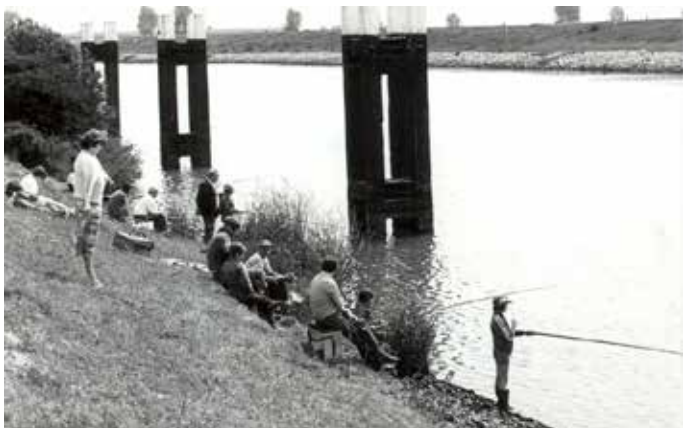
Viswedstrijd voor de jeugd in 1980

Dit staat voor de culturele gebruiken, tradities en ambachtelijke vaardigheden die mensen van huis uit hebben meegekregen en die zij op hun beurt doorgeven. U zult foto's kunnen bewonderen over rituelen, feesten en vieringen, maar ook kunsten en diverse ambachten. Ook worden de activiteiten tijdens Carnaval en Sinterklaasintocht getoond.