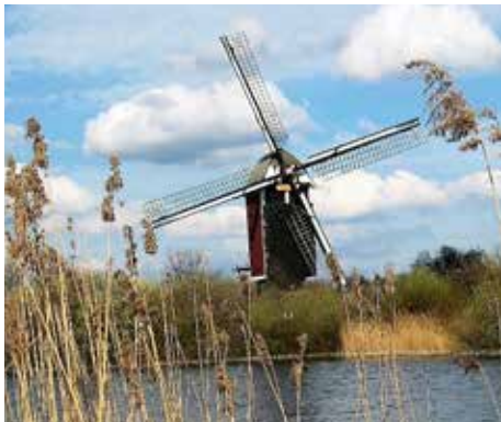
Maasmolen, Nederasselt

Geopend: zaterdag en zondag 11.00 – 16.00 uur