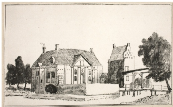
Kasteel Slimsijp, tekening Cornelis Pronk, 1732

oprijlanen, mooie gevels en grachten bestaan zelf niet meer, maar de plekken zijn nog duidelijk te traceren en vaak nog herkenbaar in de hedendaagse namen, zoals Kasteelsestraat, Sleeburgsestraat en Schonenburgseweg. De aanwezigen hebben geboeid en vaak ook verbaasd over dit luisterrijke verleden geluisterd en er werden tal van vragen gesteld.