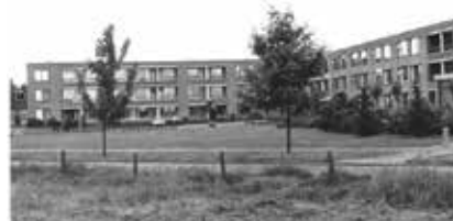
Bejaardentehuis Malderburch, 1968

Monumenten zijn historische gebouwen, archeologische vindplaatsen of door mensen aangelegde groene structuren, zoals parken. Deze worden beschermd door de rijksoverheid, provincie of gemeente vanwege hun cultuurhistorische waarde.