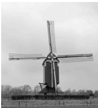
De gerestaureerde molen, 1982

Uiteraard is de molen open en te bezichtigen en geven de molenaars uitleg over dit historisch werktuig en de betekenis ervan voor Nederland.