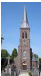
RK Sint-Antonius Abtkerk, Kerklaantje 8, Nederasselt Gemeentelijk monument