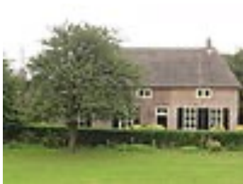
Molenaarshuis (naast de Maasmolen) Molen- weg 2, Nederasselt Rijksmonument