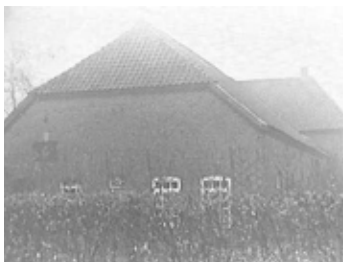
Boerderij (achtergevel) Broekstraat 2-2a, Nederasselt Gemeentelijk monument