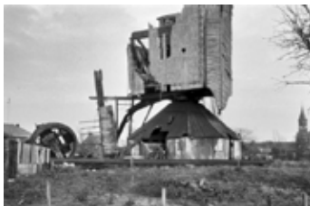
De verwoeste molen, 1972

In 1972 is onze Overasseltse molen 'de Zeldenrust' in het centrum van ons dorp door een zware november-storm verwoest en in 1982 is zijn plaatsvervanger feestelijk geopend op de nieuwe plek aan de Oude Kleefsebaan.