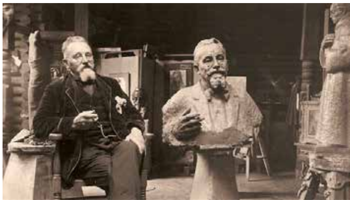
Maris portretteert voorzitter Maatschappij Rembrandt

Vóór de Tweede Wereldoorlog was hij lid van 'Sint Lucas' en van de 'Maatschappij Rembrandt', beide in Amsterdam, waarmee hij in voor- en najaar kon exposeren in het Stedelijk Museum. In Nijmegen was hij aangesloten bij 'In Consten Een' die in het Waaggebouw tentoonstellingen hield en zuidelijker had hij zich aangemeld bij de Limburgsche Kunstkring.