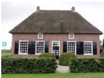
Boerderij De Lage(n) Hoed Hollestraat 20, Nederasselt Rijksmonument

Behalve de bovengenoemde monumenten heeft Nederasselt nog de volgende monumenten (niet te bezoeken).