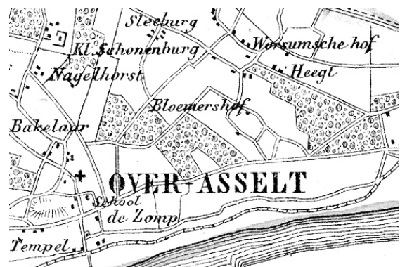
Kaart 1867 met Bloemershof op de kruising van de Worsumseweg en een dwarsweg die de Garstkampsestraat verbindt met de Valkstraat