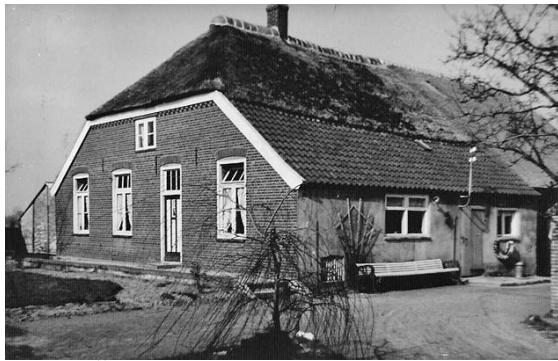
Bloemershof ca. 1955

dialogo. Hun toewijding wordt door de familie en Overasselt niet door iedereen goed begrepen. Later groeit bij velen bewondering.