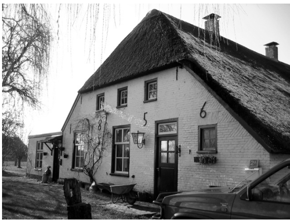
Fig. 3 Op de plek van de voormalige schaapskooi van de Heegt werd in 1856 dit huis gebouwd (Heegtseveldweg 2)

Het grootste deel van de 49 ha is weide en bouwland maar ongeveer 12 ha is zand, heide en akkermaalsbosch f .