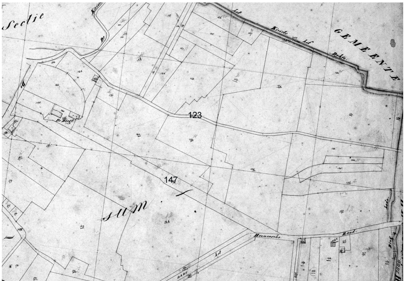
Fig. 1 Kadastrale kaart uit 1832 Links: de Heegt met schaapskooi. De meeste getoonde percelen horen bij de Heegt Perceel nr. 123 is een uitweg, de huidige Heegtveldweg; Perceel 147 is de laan die is verdwenen Rechtsonder ligt Vogelzang

Uit deze gegevens kunnen we concluderen dat de Heegt, althans in de 15 de eeuw, niet tot de abdij van de Benedictijnen van St. Valery of de Cisterciënzers van Grafenthal hoorde.