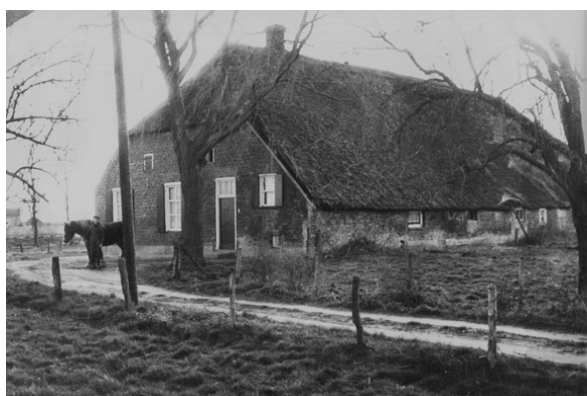
Fig. 5 De Heegt Op de onderste foto het zandpad van de boerderij naar de Heegtseveldweg