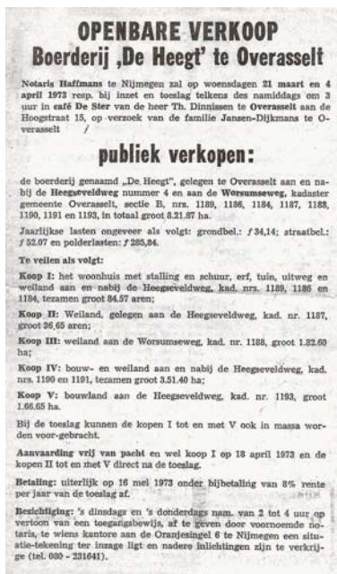
Fig. 8 Advertentie Gelderlander 1973

De koper is van Ackooy. Van het oorspronkelijke bedrijf met 49 ha is dan nog 8 ha over.