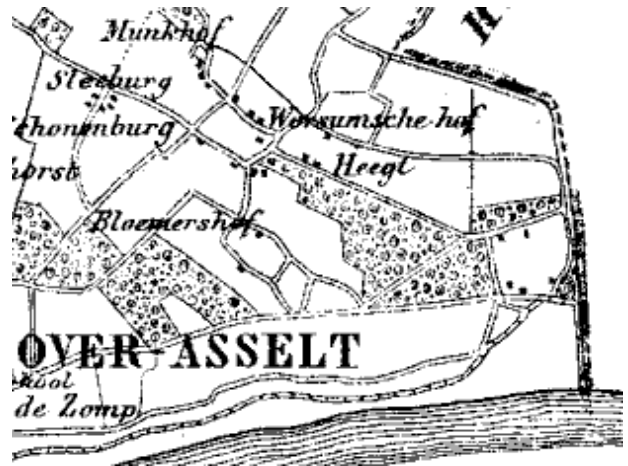
Fig. 2 Kaart van Overasselt 1867 - deel Worsum De Heegt heeft 3 gebouwen: boerderij, schuur en schaapskooi. Een groot deel van Worsum is nog woeste grond (gemarkeerd)